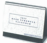
H-71 デスクスケジュールカレンダー ※専用紙袋付