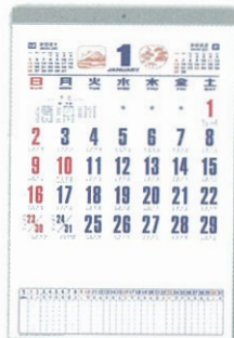
H-100 メモ付・数字月表