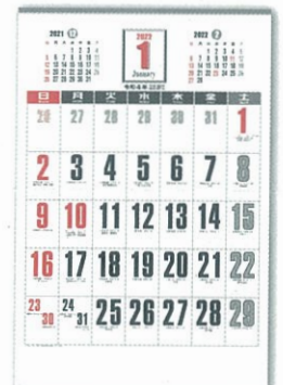
H-400 2色刷 ジャンボ数字月表 (メモ付)