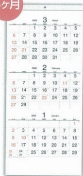
H-300 メモ付・シンプル 3ヶ月文字月表