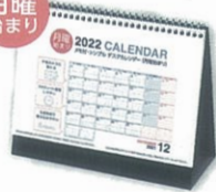
H-69 メモ付・シンプル デスクカレンダー(月曜始まり) ※専用紙袋付