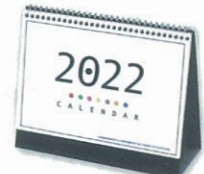
H-72 カラースタンド ※専用紙袋付