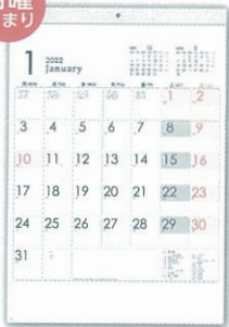
H-2100 メモ付・シンプル 文字月表 (月曜始まり)