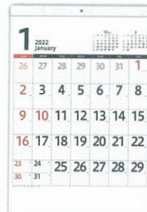
H-120 メモ付・シンプル文字月表