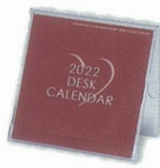
H-70 CDデスクカレンダー(文字) ※専用紙袋付